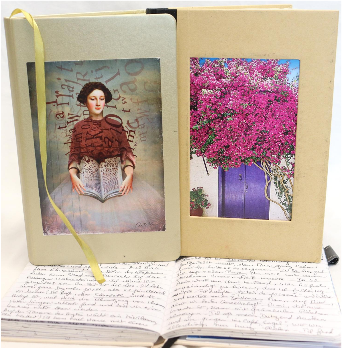
Die Tagebücher von Denise G. stammen aus der Zeit von 2020 bis 2024. In vielen Einträgen steht das Leben mit Corona im Mittelpunkt (Reg. 1695 / Sig. 2014)